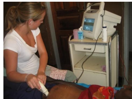
Het nieuwe echoapparaat, “DR. Jossie”

Ik ben helemaal blij en ontzettend dankbaar. Om het echoapparaat eindelijk te kunnen gebruiken is echt geweldig en om te zien hoe een meisje van 20 glundert bij het zien van haar ienienie baby'tje in haar buik geeft een super gevoel.